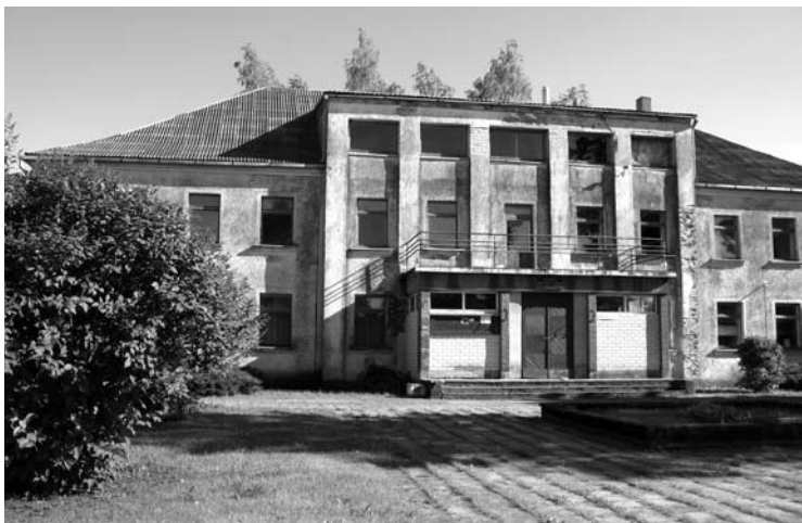
Prabangioje „Lenino keliu“ kolūkio kontoroje dabar veikia Vaitkūnų biblioteka ir kaimo kultūros namai.